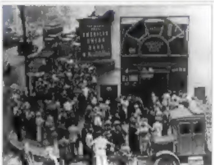
Pessoas reunidas na frente de um banco, durante o período da Grande Depressão. Esse período foi marcado por repentinas perdas de ações e houve casos de suicídio, após acionistas descobrirem que perderam tudo.